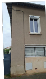
Réparation câble ENEDIS