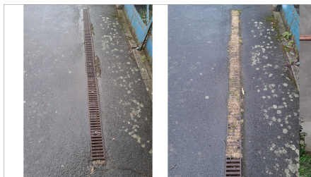
Nettoyage de caniveau bloqué